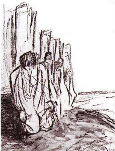
Dessin de Jacqueline LAISNE

Le 1 er avril 1915, le lieutenant Chapey commandant de la 17 ème Cie du même régiment écrit au sujet du conseil de guerre « Les témoins furent pris parmi les chefs qui avaient passé les 3 jours dans les caves. Mais on prit bien garde de faire appeler les 4 seuls officiers, dont j'étais, qui avaient passé les 3 jours auprès des hommes et qui, seuls, auraient pu dire la vérité. L'affaire a été truquée d'un bout à l'autre, je le dis en toute conscience : les 4 caporaux sont morts assassinés ».