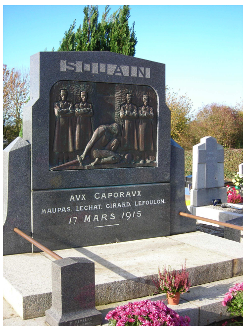
Monument aux fusillés de Souain Cimetière de Sartilly