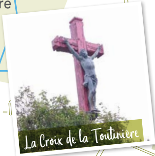
La Croix de la Toutinière

Sur votre parcours... La Métairie, lieu de naissance de Saint Auguste Chapdelaine. La paroisse englobant Sartilly-Baie-Bocage porte le nom de ce prêtre-missionnaire catholique né à La Rochelle-Normande, le 6 janvier 1814, dans la ferme parentale de « La Métairie ». Mort exécuté en Chine, dans la province du Kouang-si (Guangxi), le 29 février 1856, il a été béatifié en 1900 et canonisé le 1 er octobre 2000 par le pape Jean-Paul II.