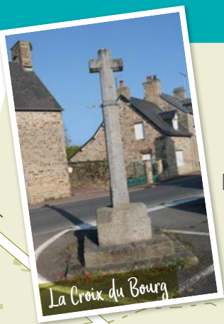
La Croix du Bourg

Le saviez-vous ? Les clous de balisage des chemins de Saint-Michel représentent la silhouette du Mont-Saint-Michel, la coquille et le bourdon, emblèmes du pèlerin.