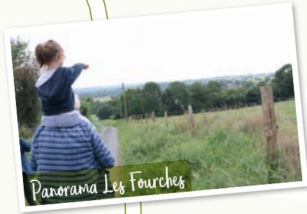
Panorama Les Fourches