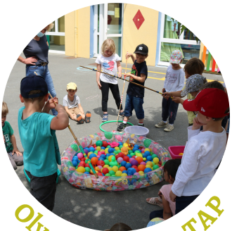
Olympiades des TAP