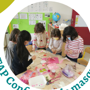
TAP Confection de masques

Dossier d'inscription téléchargeable sur le site : www.sartilly-baie-bocage.fr ou sur l'Espace Famille Version papier disponible à la mairie de Sartilly.