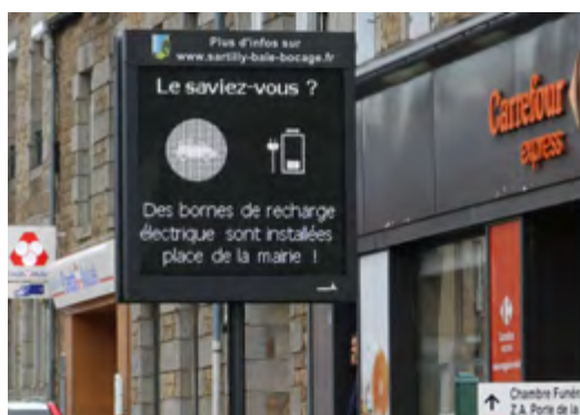
Le panneau lumineux double face