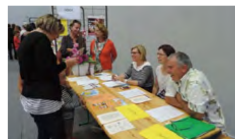
Forum des associations sportives le 2 septembre