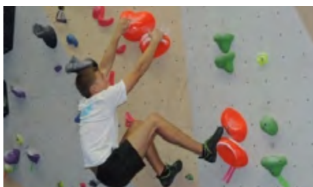
Escalade de bloc