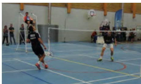
Badminton avec un joueur de l'équipe de France

très largement le territoire de la communauté d'agglomération. Ainsi, dès le 1 er octobre, une compétition départementale d'escalade, l'Open Bloc, s'est déroulée dans ses murs avec la participation de 140 grimpeurs, des poussins aux vétérans.