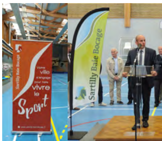
Un kakemono et une oriflamme à l'occasion de l'inauguration du complexe sportif