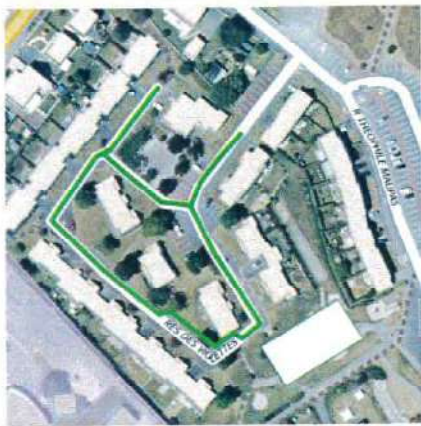
Résidence les Violettes