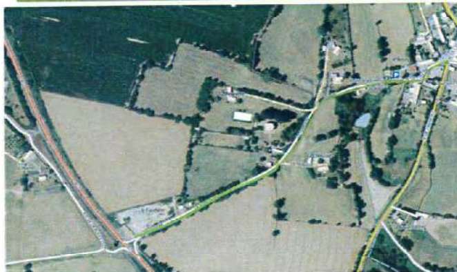
La Furetière – commune déléguée de Montviron